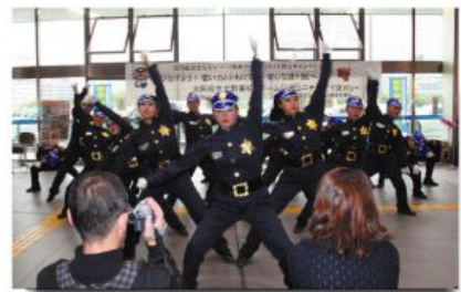
手製のポリスタイルで華麗な演技 を披露したダンス部のメンバーら