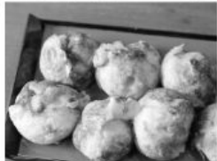
明石焼き風にかんわりと焼き上げた「と焼き」

「たこ焼き・こいこい」 淀川区三国本町3-36-17 ★営業時間：11時30分～23時30分 第1・3月曜休み ※電話はありません