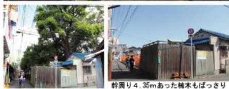
幹周り4.35mあった楠木もぼっさり